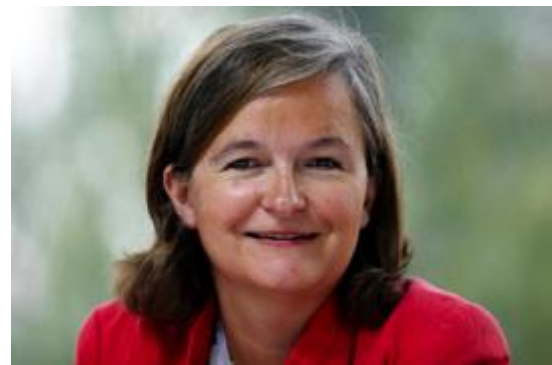
Nathalie Loiseau

2012. Elle est Chevalier dans l'ordre de la Légion d'Honneur et Officier de l'Ordre National du Mérite. Elle est l'auteur de l'essai Choisissez tout , publié en septembre 2014 aux éditions Jean-Claude Lattès.