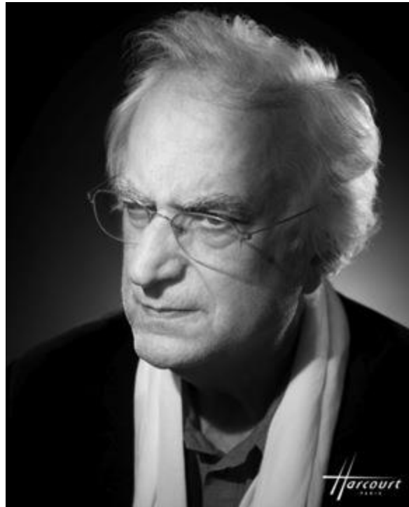
Bertrand Tavernier

Cinéphile passionné, il a écrit plusieurs ouvrages importants, notamment sur le cinéma américain, et donné de nombreuses conférences. Dans les années 60, il fut l'un des premiers à interviewer des réalisateurs étrangers et à analyser thématiquement leurs filmographies.