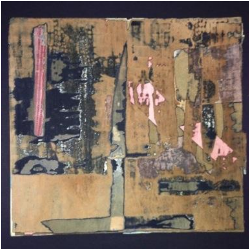
Boulevard du crépuscule