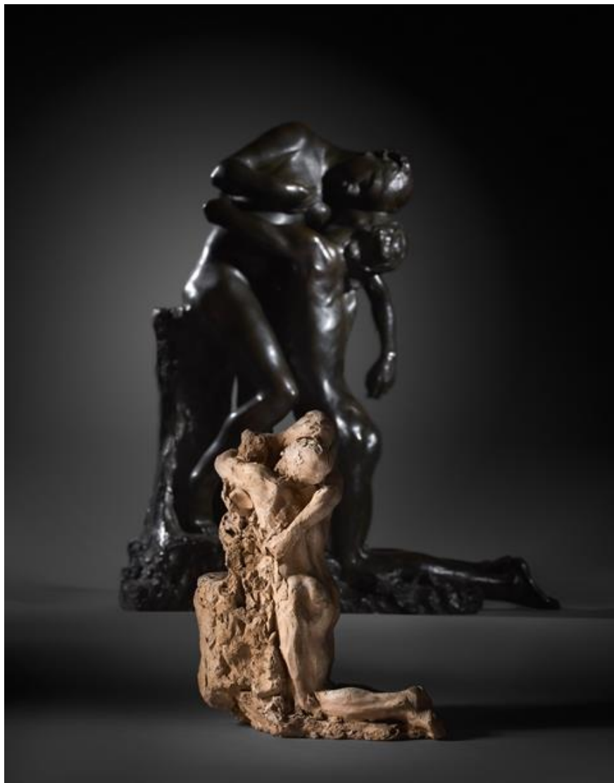
Camille Claudel, Sakountala , esquisse, terre-cuite, vers 1886, estimation : 50 000 - 70 000 € / 55 000 - 77 000 $ ; Camille Claudel, L'Abandon , grand modèle, épreuve en bronze à patine brune, fonte au sable, Blot, création 1886, fonte ente 1905-1922, estimation : 600 000 - 800 000 € / 660 000 - 880 000 $

Vente le 27 novembre 2017, à 19h, à Paris