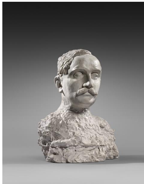
Camille Claudel, Etude pour le Buste de Paul Claudel à trente-sept ans , plâtre, 1905, estimation : 20 000 - 30 000 €/ 22 000 - 33 000 $

Camille Claudel continue d'exposer ses œuvres au Salon des Artistes français et au Salon d'Automne mais en 1906 sa santé s'altère et son comportement se fait étrange: elle prend l'habitude au début de chaque été de briser à coup de marteau toutes les œuvres accumulées dans ses ateliers. En 1913, après la mort de son père, Camille Claudel est internée à Ville-Evrard puis transférée à Montdevergues près de Villeneuve-lès-Avignon où elle vivra encore 30 ans, jusqu'à sa mort en 1943.