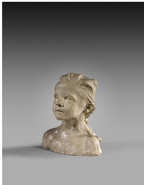
Camille Claudel, La petite Châtelaine à la natte courbe , plâtre vers 1892-1893, estimation : 50 000 - 70 000 € / 55 000 - 77 000 $