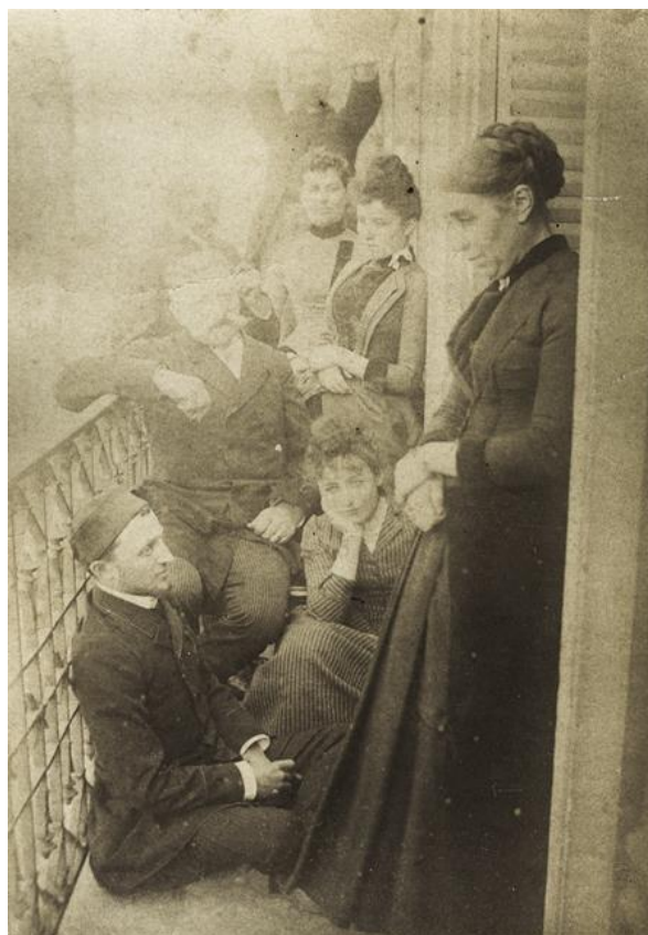
La famille Claudel