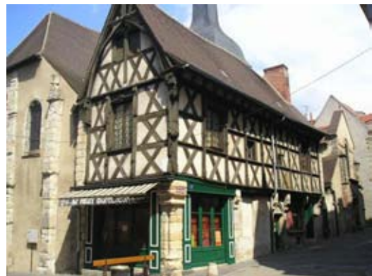
Cité médiévale de Montluçon