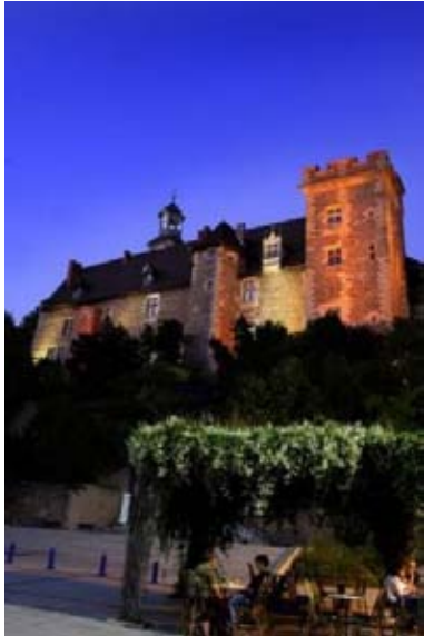
Château des Ducs de Bourbon

A l'occasion de l'exposition internationale Pastels du monde, un programme culturel et touristique a été concocté en partenariat avec l'Office de tourisme Vallée de Montluçon afin de proposer aux visiteurs du salon une découverte de Montluçon et ses alentours :